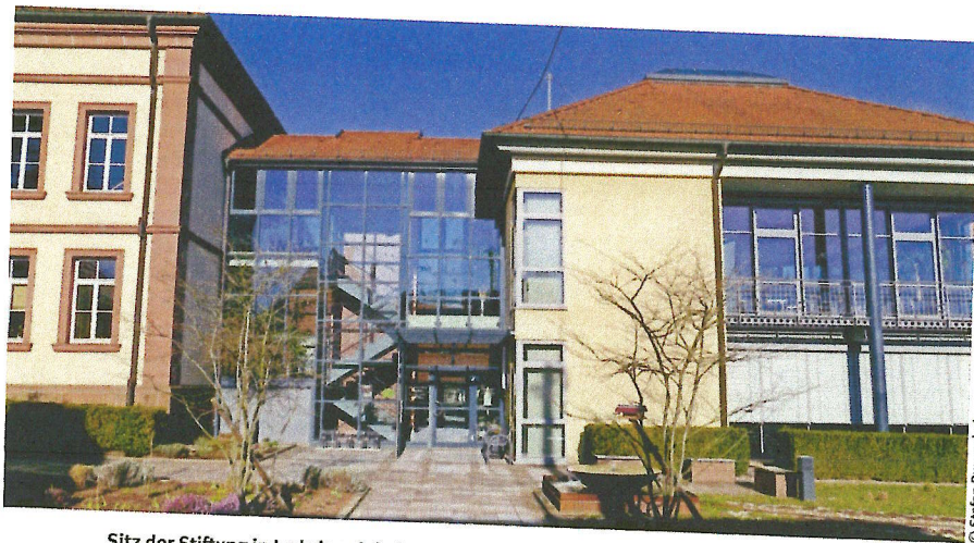
Sitz der Stiftung in Ludwigswinkel