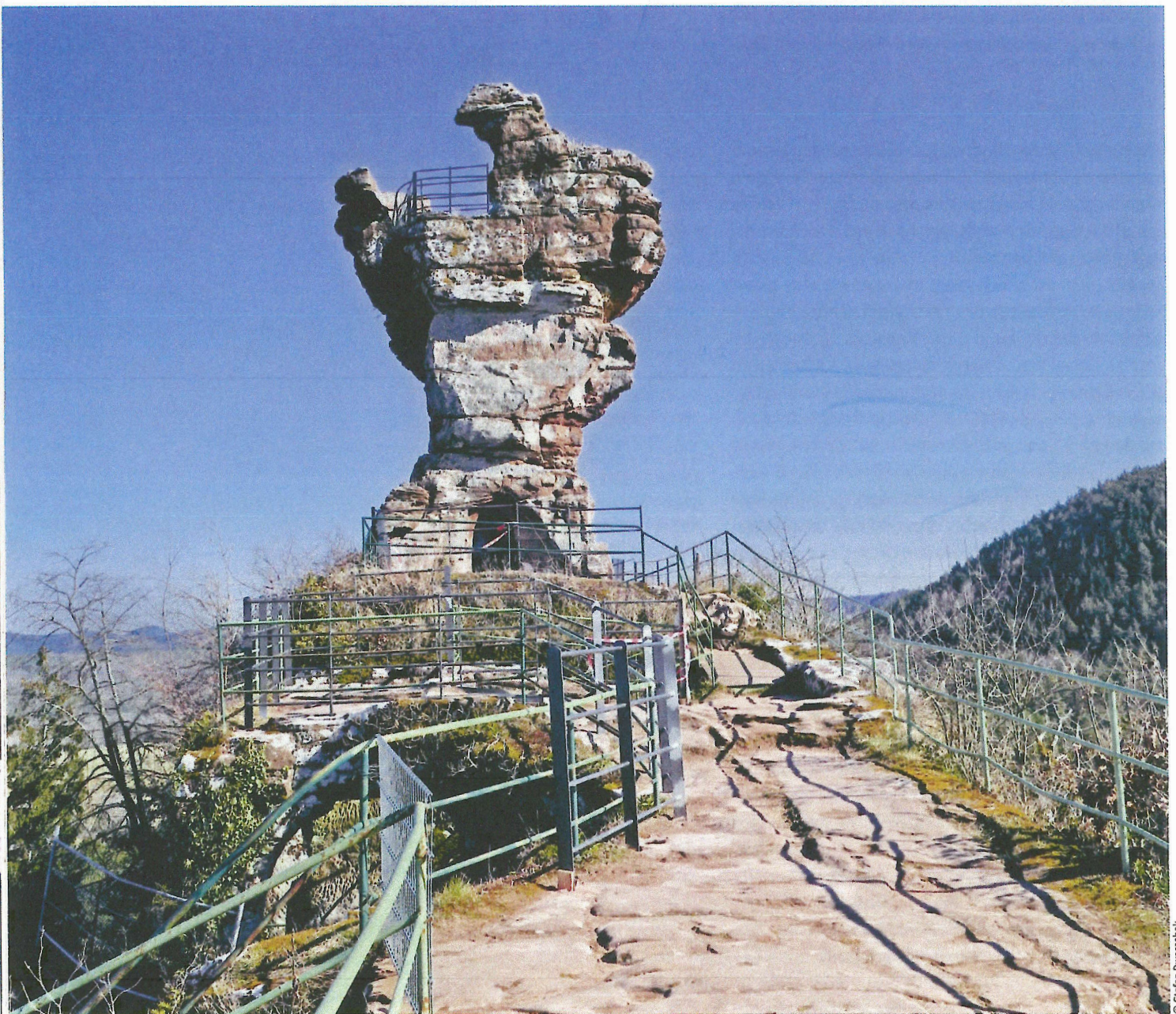
Ohne Unterstützung der Daniel-Theysohn-Stiftung wäre sie nicht mehr begehbar: die Burgruine Drachenfels.