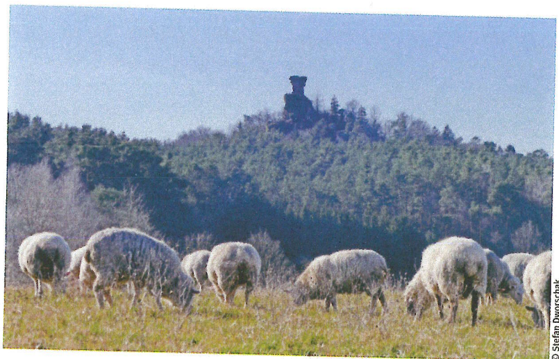
Schafe unter der Burgruine: Die Region um den Stiftungssitz ist sehr ländlich geprägt.

vestment der Stiftung also atypisch diversifiziert in nur einem Unternehmen“, sagt Pieper. Dann verkaufte diese ihr Unternehmen an die Hager-Gruppe. „Zwischen beiden Seiten bestanden gute Beziehungen, auch Hager ist ein Familienunternehmen.“