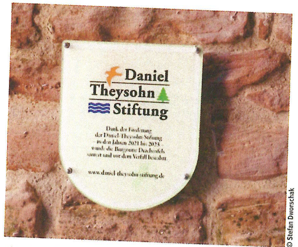
Hinweistafel in der Burgruine Drachenfels

sein. Es ist ein ständiger Prozess zu überlegen, wo es Ansatzpunkte gibt.“